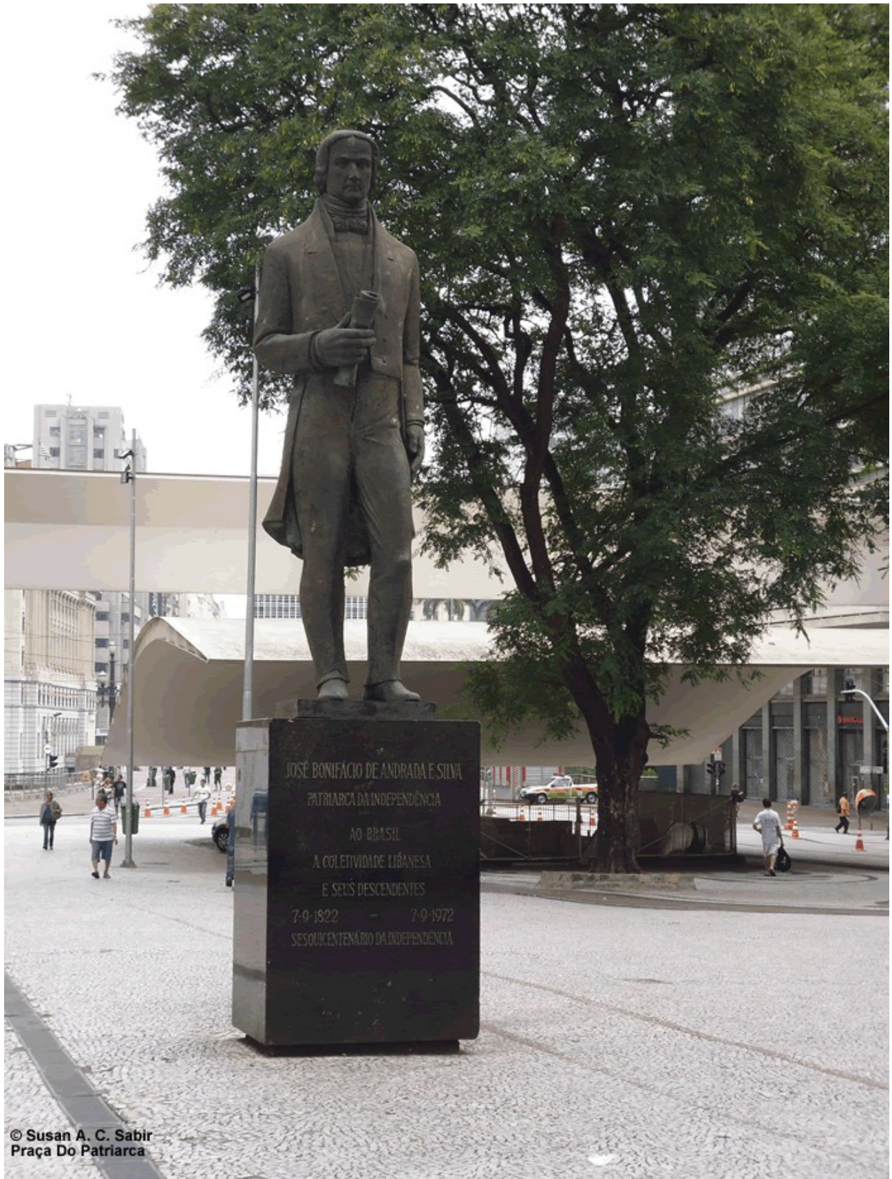
© Susan A. C. Sabir Praça Do Patriarca