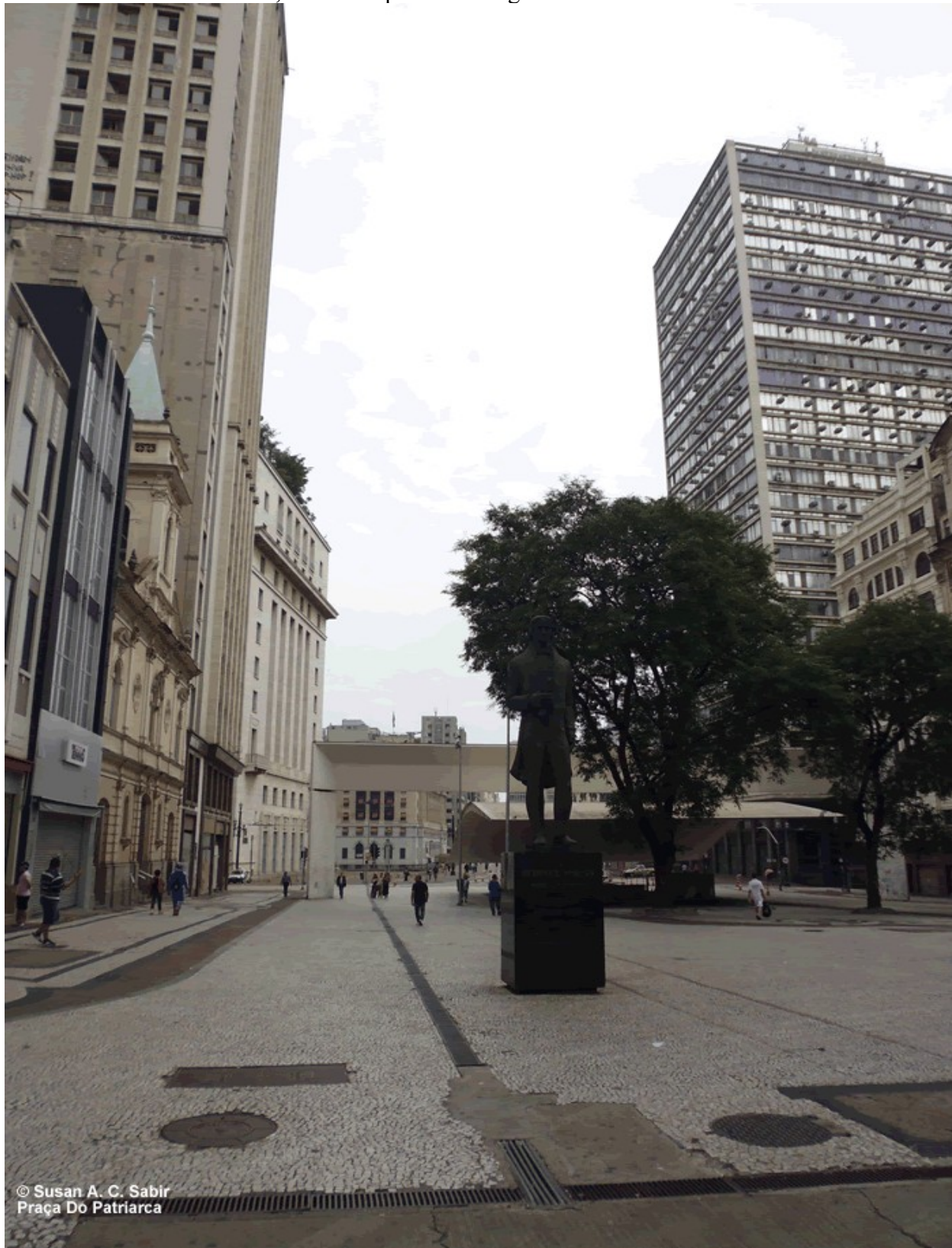
Praça Do Patriarca

“Uma das praças mais antigas da cidade, começou a ser construída em 1912. Seu nome é uma homenagem a José Bonifácio de Andrada e Silva. No centro da praça há uma entrada para a galeria Prestes Maia, que liga ao vale do Anhangabaú. Neste espaço há um pórtico desenhado por Paulo Mendes da Rocha. A cobertura é um átrio metálico com 40 metros de vão, marcando os limites entre o centro velho e o novo, de dentro para fora da galeria.”